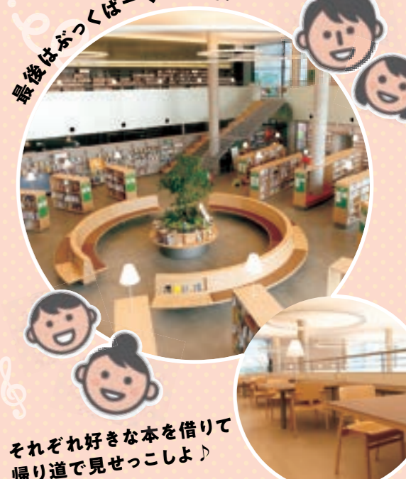
それぞれ好きな本を借りて 帰り道で見せっこしよ♪