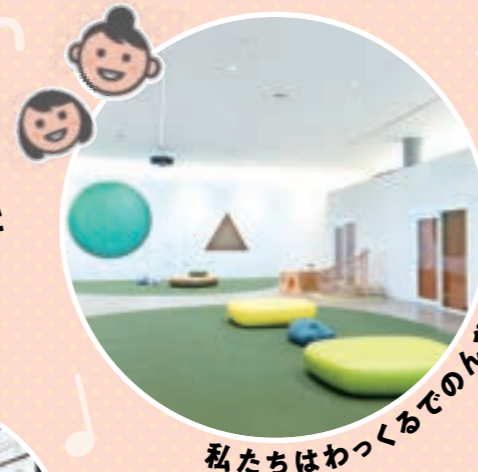
私たちはわっくるでのおんぴりありあそび